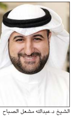
الشيخ د. عبدالله مشعل الصباح

عقد مجلس إدارة الهيئة العامة لشؤون القصر اجتماعه أمس برئاسة وزير العدل وزير الأوقاف والشؤون الإسلامية وزير الدولة لشؤون تعزيز النزاهة رئيس مجلس إدارة الهيئة عبدالعزیز الماجد. وقال الماجد في بيان صحافي إن المجلس بحث بنود جدول الأعمال واطمان على سلامة أداء الهيئة القانوني بعد الاطلاع على تقرير تفصيلي بشأن الدعاوى القضائية والأحكام الصادرة بشأنها ومبرراتها، لافتا إلى أن بيانات التقرير كشفت عن أن المنازعات المدنية تركزت على إنهاء حالات الشيوخ عن طريق بيع العقارات في المزاك العلني وكلها حقوق قانونية مترتبة على التراكم لصالح الورثة أو الشركاء، كما تركزت الأحكام المتعلقة