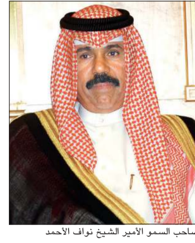
صاحب السمو الأمير الشيخ نواف الأحمد

بعث صاحب السمو الأمير الشيخ نواف الأحمد ببرقية تعزية إلى الرئيس جوزيف آر. بايدين رئيس الولايات المتحدة الأميركية الصديقة، عبر فيها سموه عن خالص تعازيه وصادق مواساته بضحيا العاصفة الثلجية التي اجتاحت عددا من الولايات الأميركية والتي أسفرت عن سقوط العديد من الضحايا والمصابين وتدمير كثير من المرافق العامة والممتلكات الخاصة، راجيا سموه للمصابين سرعة الشفاء وأن يتمكن المسؤولون في البلد الصديق من تجاوز آثار هذه الكارثة الطبيعية، متمنيا سموه له وافر الصحة والعافية وللولايات المتحدة الأميركية وشعبها الصديق دوام التقدم والازدهار.