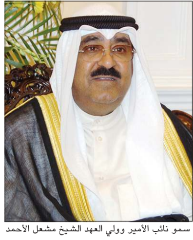
سمو نائب الأمير وولي العهد الشيخ مشعل الأحمد

استقبل سمو نائب الأمير وولي العهد الشيخ مشعل الأحمد، بقصر بيان صباح أمس، رئيس مجلس الوزراء سمو الشيخ أحمد نواف الأحمد الصباح. كما استقبل سمو نائب الأمير وولي العهد، النائب الأول لرئيس مجلس الوزراء وزير الداخلية وزير الدفاع بالإنابة الشيخ طلال الخالد. كما بعث سمو نائب الأمير وولي العهد الشيخ مشعل الأحمد ببرقية تعزية إلى الرئيس جوزيف آر. بايدين رئيس الولايات المتحدة الأميركية الصديقة، ضمنها سموه خالص تعازيه وصادق مواساته بضحيا العاصفة الثلجية التي اجتاحت عددا من الولايات الأميركية، متمنيا سموه للمصابين سرعة الشفاء.