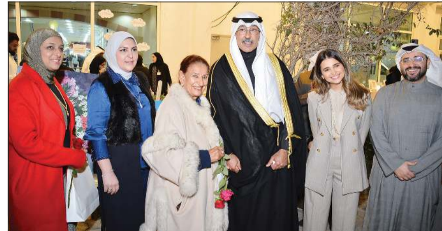
الشيخ فواز الخالد والشيخة شيخة العبدالله وهنادي المبلش وعدد من الحضور (زين علام)

تفخر محافظ الأحمدية الشيخ فواز الخالد بالرعاية التي توليها الكويت قيادة وحكومة لإبنائها وبانها من ذوي الإعاقة، والتي تتعاظم يوما بعد يوم وترجعها جهات الاختصاص على أكل وجهه، لنجني جميعا ثمارها عاما بعد عام محليا وإقليميا وعالميا. جاء ذلك خلال حضور ورعاية الشيخ فواز الخالد ليوم محافظة الأحمدية الرابع للوفاء لذوي الإعاقة تحت شعار «إداعات وهمم» بالشراكة والتعاون مع مجمع كويت ماجك، والهيئة العامة لشؤون ذوي الإعاقة وشركة البترول الوطنية وبدعم من بنك برقان. وجال الخالد على مقر الجهات المشاركة التي وصلت إلى 25 جهة، معربا عن إعجابيه بتنوع المشاركات والحرص على تقديم أفضل الإبداعات والمهارات والمنتجات اليدوية والفنية والتراثية، مجددا التأكيد على اعتزازه ومحافظة الأحمدية الدائم بذوي الإعاقة