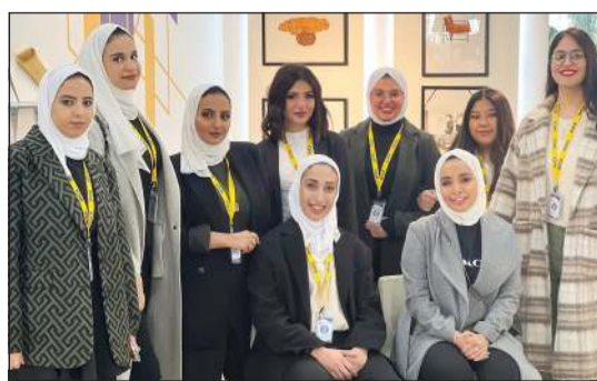
جانب من مشاركة الطالبات في معرض «مرزام»

مرافق الكلية من مختبرات تقنية ومرافق رياضية، وكانت لدى السفير محطة في معرض الأعمال الفنية لطالبات تخصص الديكور والتصميم الداخلي، تحدث خلالها مع الطالبات عن