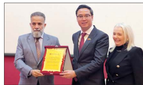
دفع تكريمية للسفير الفيتنامي

مرافق الكلية من مختبرات تقنية ومرافق رياضية، وكانت لدى السفير محطة في معرض الأعمال الفنية لطالبات تخصص الديكور والتصميم الداخلي، تحدث خلالها مع الطالبات عن