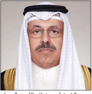
سمو الشيخ أحمد نواف الأحمد الصباح

بعث رئيس مجلس الوزراء سمو الشيخ أحمد نواف الأحمد الصباح ببرقية تعزية إلى الرئيس جوزيف آر. بايدين رئيس الولايات المتحدة الأميركية الصديقة، ضمنها سموه خالص تعازيه وصادق مواساته بضحيا العاصفة الثلجية التي اجتاحت عددا من الولايات الأميركية.