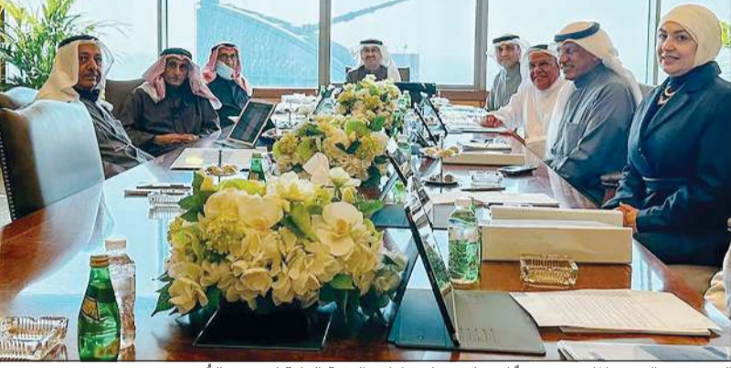
الوزير عبدالعزیز الماجد مترئسا اجتماع مجلس إدارة الهيئة العامة لشؤون القصر

بالمديونيات المترتبة على المشمولين بالرعاية من المتوفين والمحجور عليهم في ديون ثابتة وفق عقود ملزمة واجبة السداد، ومنها الفروض البنكية ومديونيات الشركات والتي تم إثبات استحقاتها أمام السلطة القضائية وبعد استنفاد جميع درجات التقاضي. وأضاف الماجد أن المجلس استعرض الدليل الشامل للإجراءات التي أصدرته الهيئة وتتضمن 1101 إجراء لمعاملات 107 وحدات في الهيئة، مبينا أن تلك الإجراءات ستكون محل تطوير وتقييم ودراسة مستمرة مبنية على الملاحظات الواردة من الإدارات صاحبة الاختصاص. وفي مجال الاستثمار، كشف عن أن المجلس استعرض إيضاحات بشأن إيرادات الاستثمارات الهيئة خلال الأشهر التسعة الأولى من عام 2022.