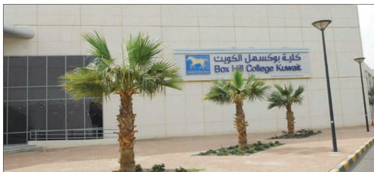
مبنى كلية بوكسهل الكويت

وأضاف القاسم وماكنيللي ان الكلية تحرص على التدريب الميداني لطالباتها في مختلف جهات سوق العمل، بالإضافة إلى ان برامجها تأتي من الجامعة الأم في أستراليا ويتم تعزيزها بمواضيع ذات صلة بالواقع المحلي، وبالتالي فإن اهداف المواد التي يتم طرحها تأتي متسجمة مع بيئة العمل من أجل تمكين الطالبة في سوق العمل المحلية من بداية التحاقها بالكورس الأول للدراسة حتى تخرجها في الكلية، كما ان الأساتذة أثناء تدريسهم المناهج الدراسية يقومون بربط الدراسة النظرية ببيئة العمل الحقيقية الطالبات في مجموعة لانجاز مشروع يحاكي مختلف الجوانب الإدارية للعمل الحقيقي، فضلا