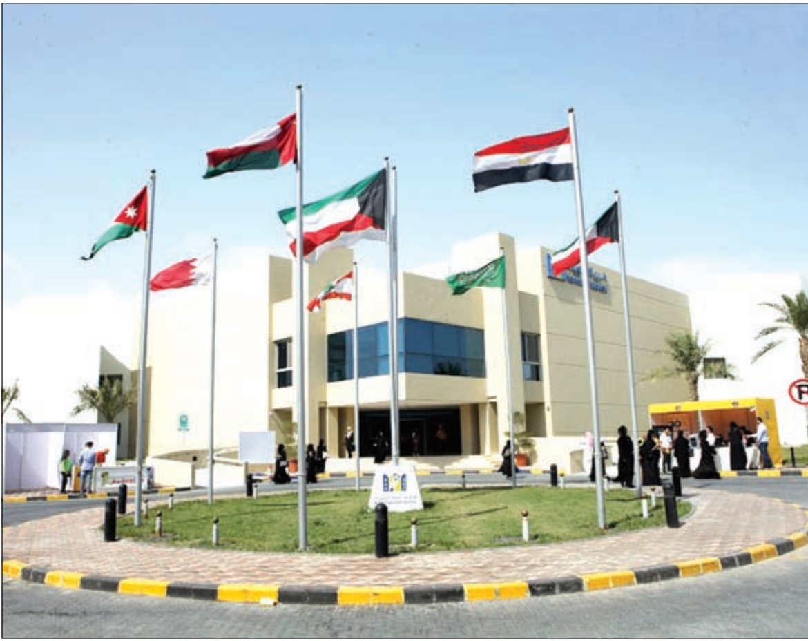
مبنى الجامعة العربية المفتوحة